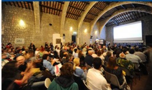
ROCCA DEI PAPI 250 posti