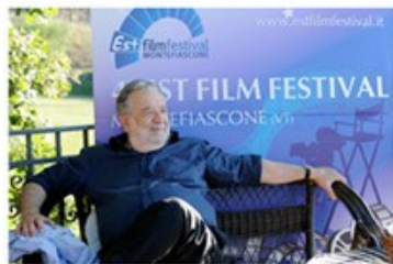
Pupi AVATI 2008, 2010