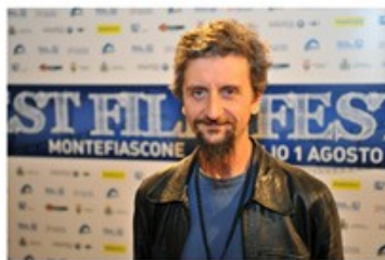
Ascanio CELESTINI 2011