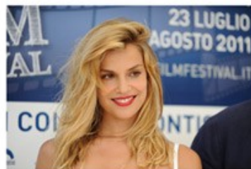
Micaela RAMAZZOTTI 2011