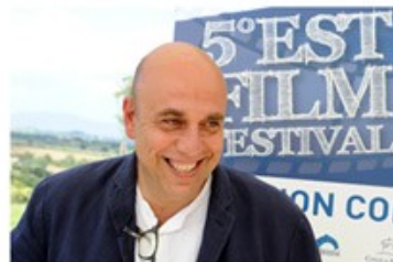
Paolo VIRZÌ 2011