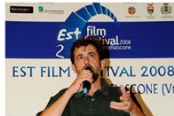
Nanni MORETTI 2008