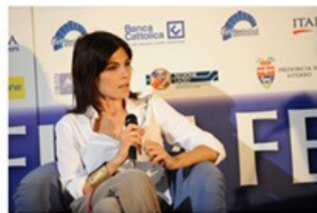
Valeria SOLARINO 2010