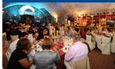
ENOTECA PROVINCIALE 200 posti