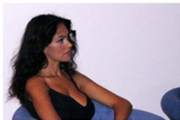
Maria Grazia CUCINOTTA 2007