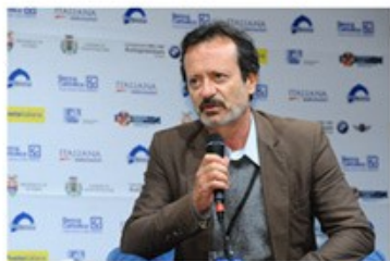
Rocco PAPALEO 2011