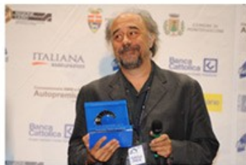
Giorgio DIRITTI 2007, 2008, 2010