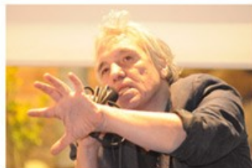
Abel FERRARA 2009