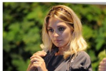
Carolina CRESCENTINI 2009