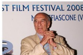
Giuliano MONTALDO 2008