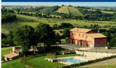
COLLE DI MONTISOLA 150 posti