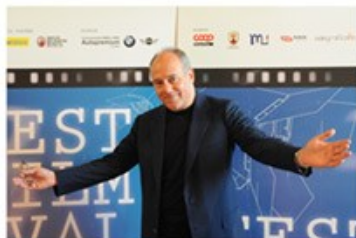
Carlo VERDONE 2009, 2010