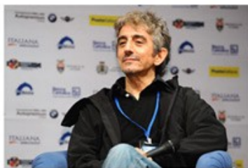
Sergio RUBINI 2011