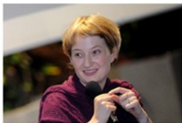
Alba ROHRWACHER 2009