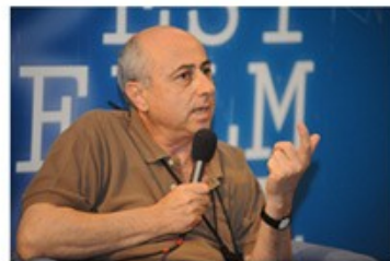
Roberto FAENZA 2009