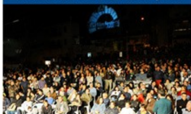
PIAZZALE MAURI 1500 posti