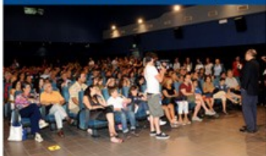
CINEMA GALLERY 300 posti