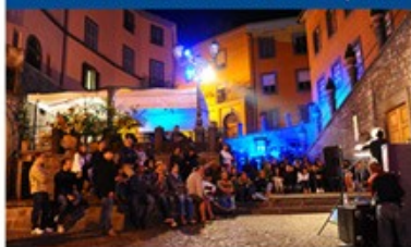
LARGO PLEBISCITO 200 posti