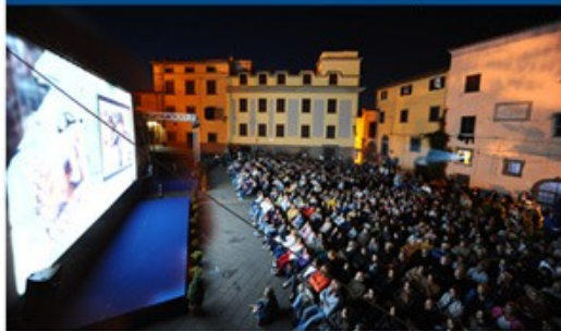
PIAZZALE FRIGO 700 posti